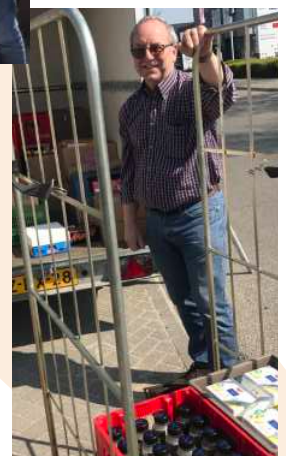
Donatie van SDC-Putten, Vale Ouwe en Laakhuisje