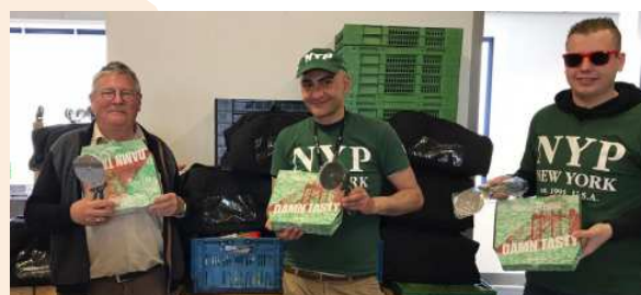
Donatie New York Pizza