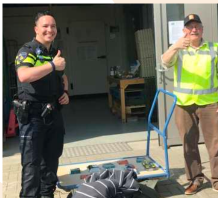
Politie doneert scheerproducten